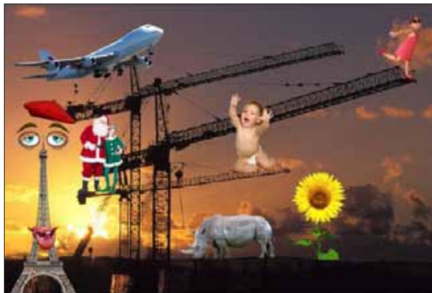
Photo retouchée par les élèves