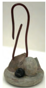
Red Wire Schwitters. 1944 Sculpture en métal peint, pierre et techniques mixtes Tate Modern, Londres