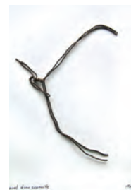
Envol d'une corneille Marcel Miracle. 2021 MarcelMiracle