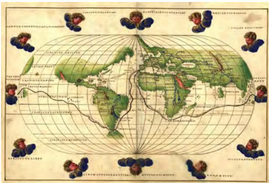
Carte du premier tour du monde

Aux XV e et XVI e siècles, de grands ..... comme Christophe ....., Vasco de Gama ou Jacques Cartier découvrent des terres jusque-là inconnues : les Antilles, l'Amérique, le Canada... L'expédition de ....., elle, prouve qu'on peut faire le tour de la Terre par voie maritime !