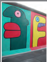
Hommage à la jeune génération Thierry Noir East Side Gallery, Berlin