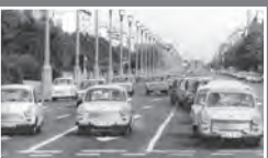
Karl-Marx Allee Berlin-Est, 1982