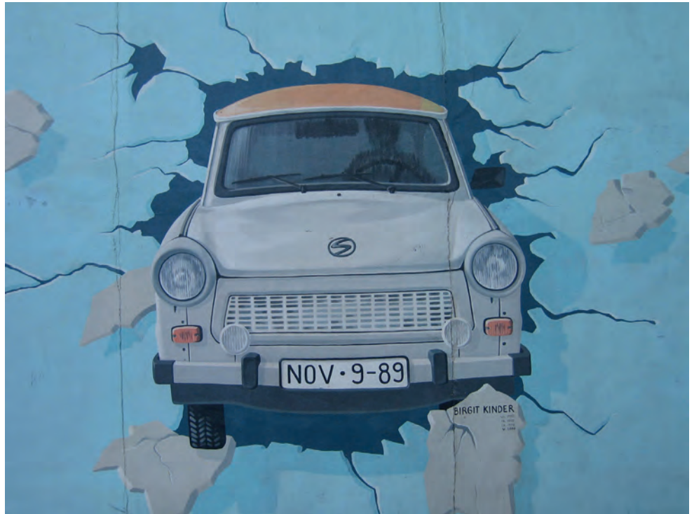
Trabant traversant le Mur – Birgit Kinder East Side Gallery, Berlin