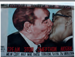
Le baiser de l'amitié Dmitriji Vrublel East Side Gallery, Berlin