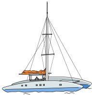
Catamaran (deux coques)